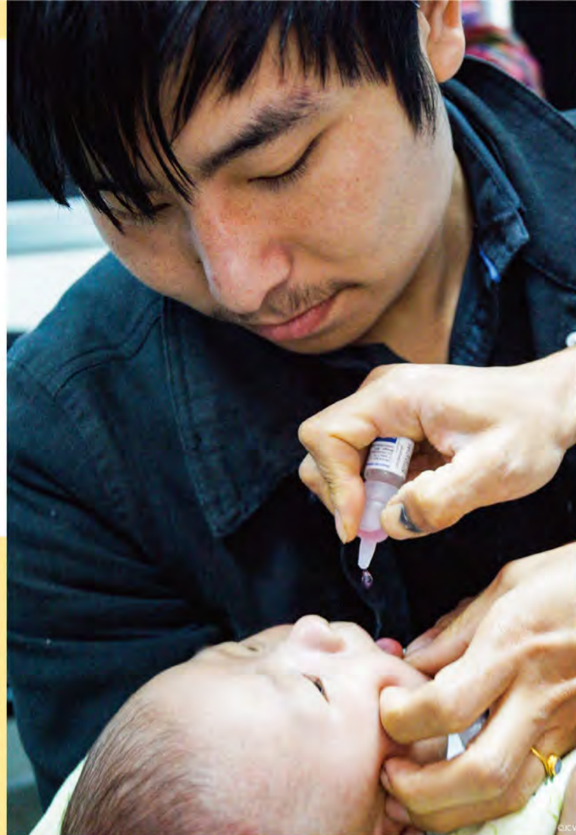
八県病院でポリオワクチン接種を受ける赤ちゃん