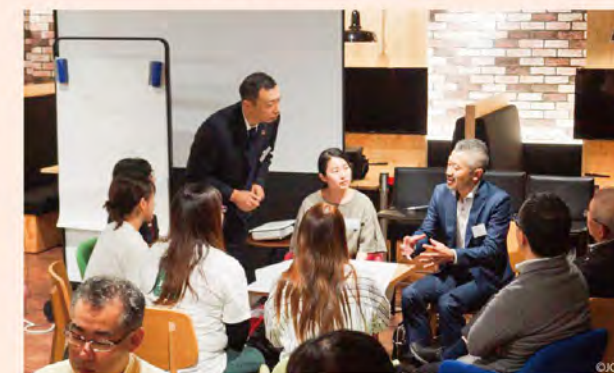
支援者交流会は活発な意見交換の場になりました。