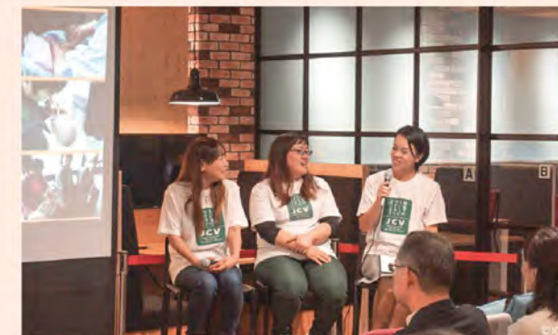
視察に参加された支援者様にお話しいただきました。

ポリオワクチンを発明したジョナス・ソーク博士の誕生日であり、ポリオ根絶の取り組みを周知し、ポリオフリーな世界の実現に向け、さらなる支援を呼びかける日です。